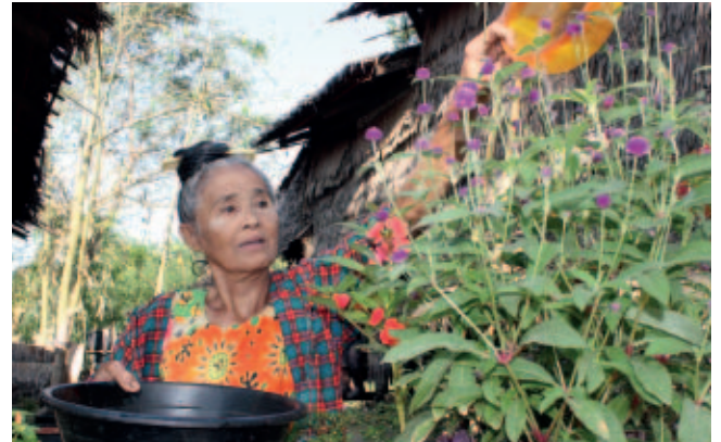
Joanne Hill/HelpAge International

notwendig, die gesunde Lebensstile, unterstützende Technologien, medizinische Forschung und Rehabilitationsmaßnahmen fördert.