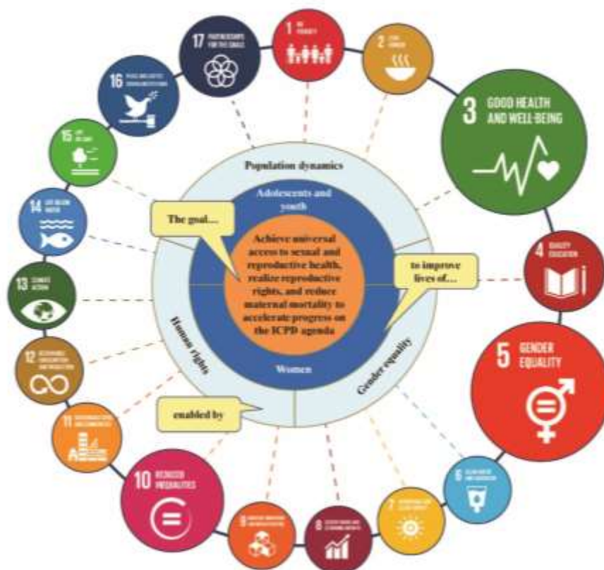
Gráfico 1. Armonización del objetivo del plan estratégico del UNFPA con la Agenda 2030

6. La Agenda 2030 brinda una grata oportunidad para seguir persiguiendo el objetivo del UNFPA e implementando el Programa de Acción de la Conferencia Internacional sobre la Población y el Desarrollo (CIPD). Al armonizar el plan estratégico con los Objetivos de Desarrollo Sostenible —de manera más directa, con los Objetivos de Desarrollo Sostenible 3 (garantizar una vida sana y promover el bienestar para todos a todas las edades), 5 (lograr la igualdad de género y empoderar a todas las mujeres y las niñas) y 10 (reducir la desigualdad en los países y entre ellos)—, el UNFPA impulsará la labor del Programa de Acción y contribuirá a la consecución del objetivo de su plan estratégico y, a la larga, a la erradicación de la pobreza. En el marco de dicha armonización, el UNFPA ha considerado prioritarios 16 indicadores de los Objetivos de Desarrollo Sostenible. El gráfico 1 muestra la armonización del plan estratégico del UNFPA con los Objetivos de Desarrollo Sostenible.